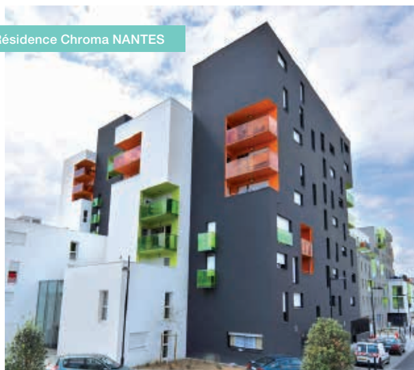
Résidence Chroma NANTES

La reconfiguration des filiales immobilières de la Caisse des Dépôts entraîne l'intégration de la SAMO au groupe SNI qui en devient l'actionnaire de référence.