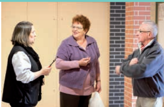
Le personnel de proximité, lien privilégié entre la SAMO et ses locataires