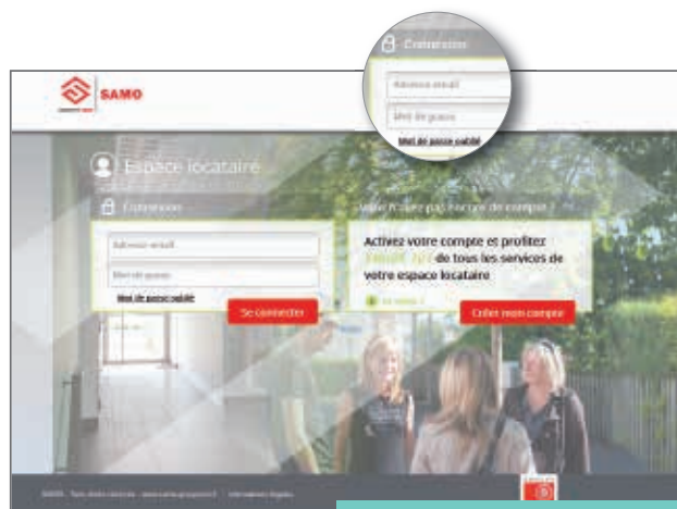
Un espace dédié à nos locataires