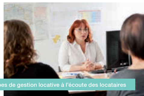
Les équipes de gestion locative à l'écoute des locataires