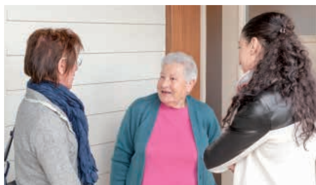
Village des aînés SAINT-MARS-DU-DESERT