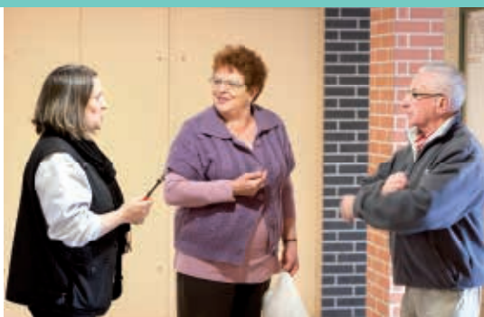
Le personnel de proximité, lien privilégié entre la SAMO et ses locataires