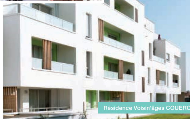
Résidence Voisin'âges COUERON